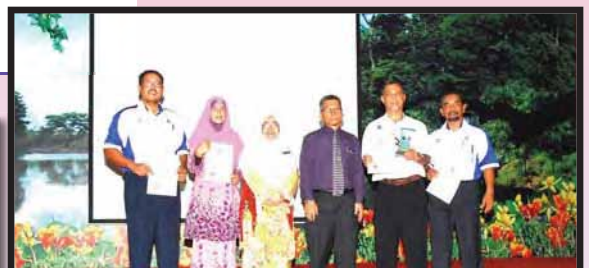
ANUGERAH EMAS KATEGORI PEDAGOGI PENSYARAH