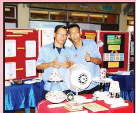
ANUGERAH EMAS KATEGORI PENGURUSAN